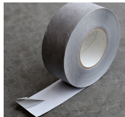
Lineren er delt 50/50