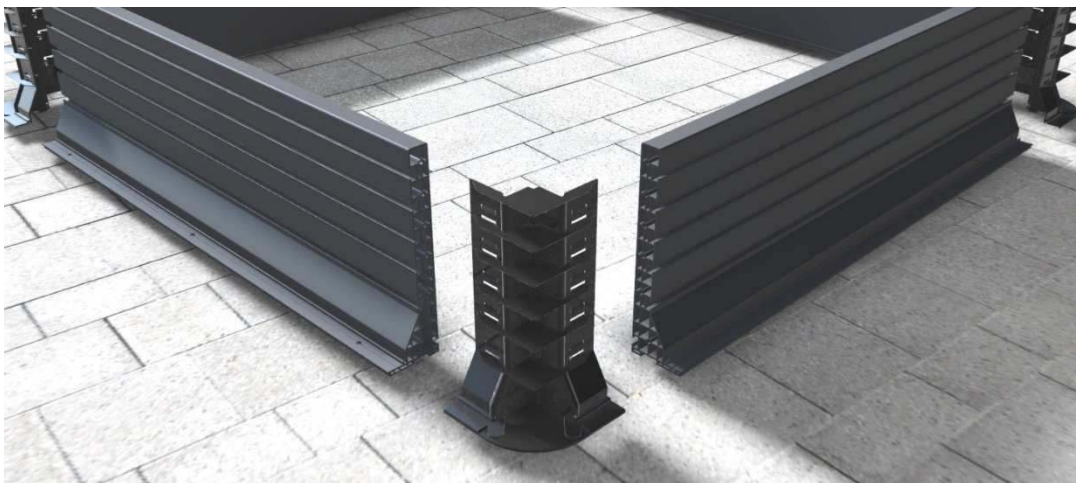
Figur 1: Sidestykker og hjørnestykke før samling

Systemet består af hule sidestykker og hjørnestykker, der samles til en ramme. Sidestykkerne udføres af PVC-plast mens hjørnestykker udføres af ABS-plast. Rammen monteres omkring vindueshullerne på ydersiden af bagmuren og udgør således falsen, hvori vinduet monteres.